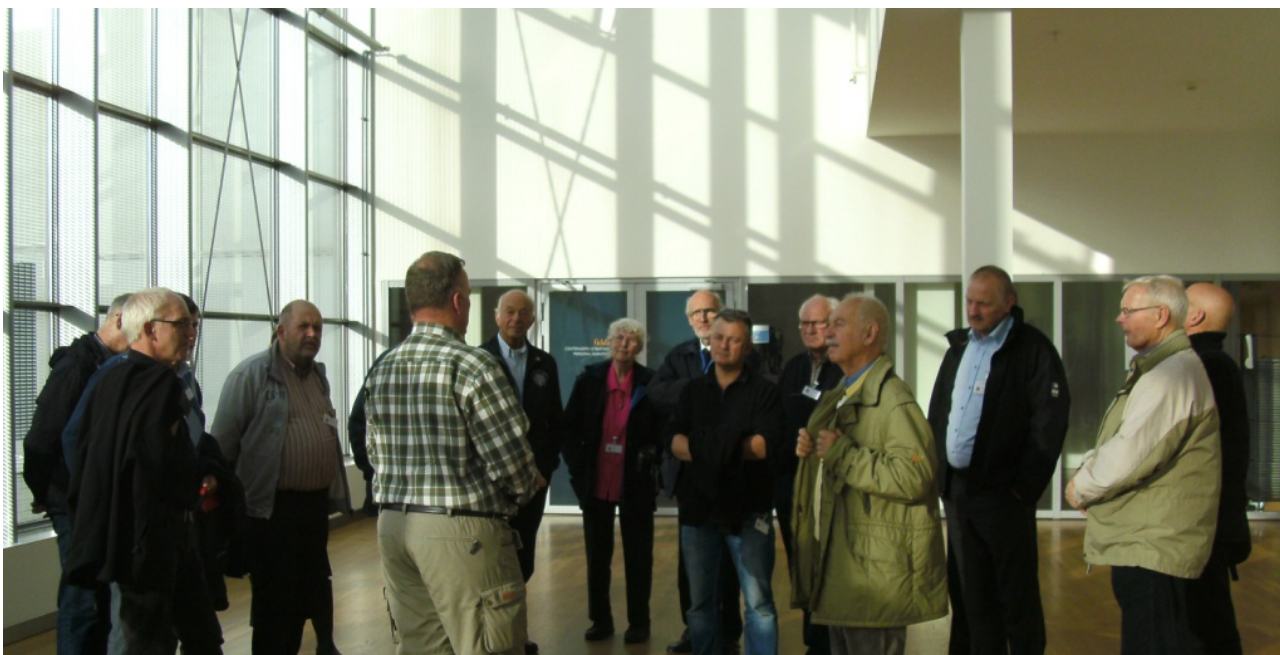
Store lyse arealer.

Centret har en døgnbemandet kontrolcentral, hvorfra man via talrige kameraer konstant kan overvåge at situationen er rolig, og straks griber ind, hvis der opstår en uønsket hændelse. Der er på hver etage patruljerende centervagter, som kan dirigeres til hjælp. De er uddannet i såvel førstehjælp som brandslukning og vejledning ved udrømning. Desuden tjekker de rydelighed, især på flugtvejene. Desuden har hver forretning en særlig uddannet person, som ved hvordan man kalder assistance og internt i forretningen kan iværksætte hjælp.