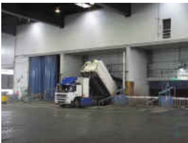
Affaldet tippes i siloen, uden at chaufføren er nødt til at stå ud af førerhuset.