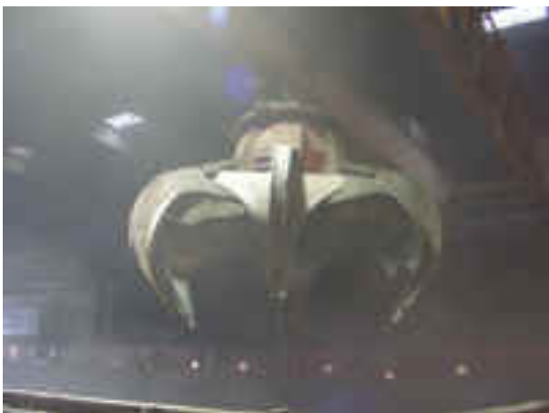
2 automatiske kraner forsynder de 4 ovne med affald, ca. 2½ tons pr. gang.