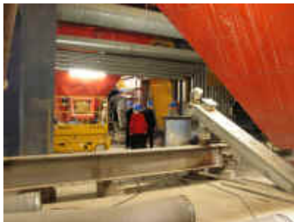
Helt nede ved bunden af ovnene, syner vi ikke Af meget.

De 4 store ovne brænder affaldet ved omkring 950 grader, og opvarmer vand til højtryksdamp, hvorved 20 % omsættes til elektricitet og 80 % omsættes til fjernvarme. Restprodukterne fra affaldsforbrændingen bliver rensed og 20 % heraf genanvendes i bygge - og anlægsarbejder og resten køres på deponi.